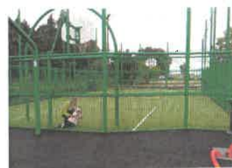
Terrain multisports de Chaintreaux

Dans le cadre de l'organisation des Jeux Olympiques en 2024, le gouvernement a proposé d'aider les communes à financer l'installation d'un city stade pour encourager la pratique du sport. Le conseil a décidé de profiter de cette opportunité. Notre demande de subvention a été acceptée et le city park sera installé sur le terrain de sports au printemps.