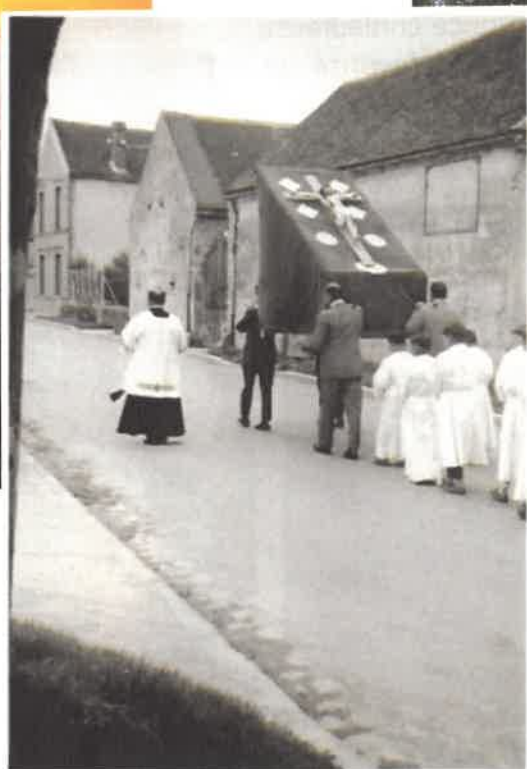
B.C, Procession à Gironville, 1961