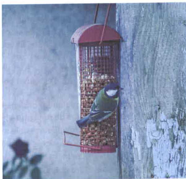
Mésange Charbonnière – Gironville

La faune hibernante de Gironville s'est endormie pour un long sommeil jusqu'au Printemps. Les chauves-souris, escargots, fourmis, hérissons, crapauds, les lérots et tant d'autres ne seront revus qu'aux beaux jours, mis à part quelques-uns se réveillant de temps à autre pour reprendre des forces comme le Hérisson !