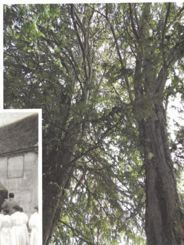
C.P, Au cœur des sapins de l'école, 2022