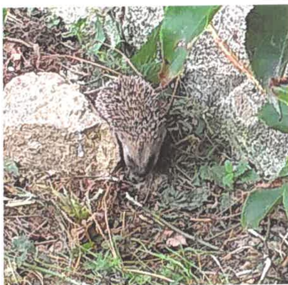
Hérisson – Gironville